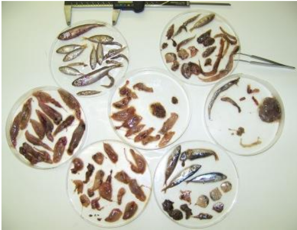
Analyse des contenus digestifs